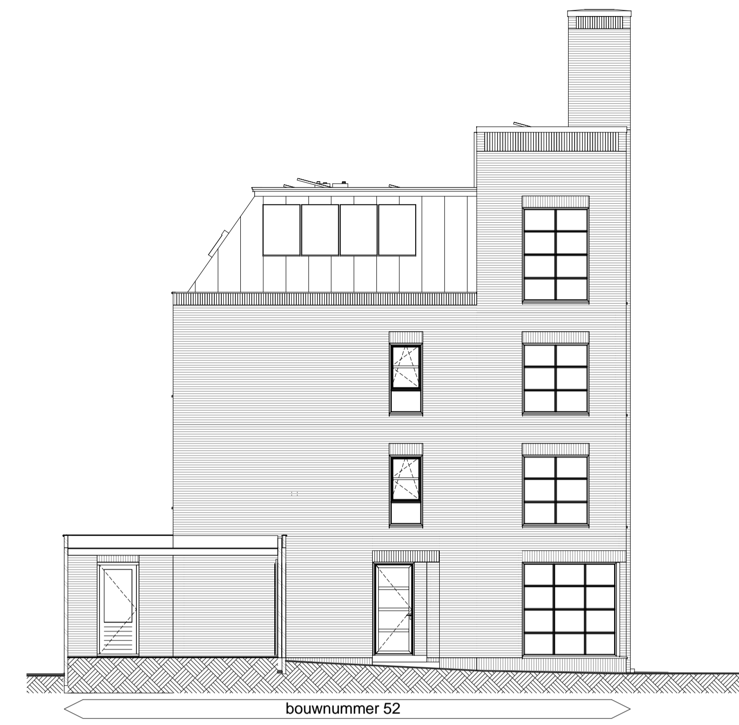
Linkerzijgevel schaal 1 : 100