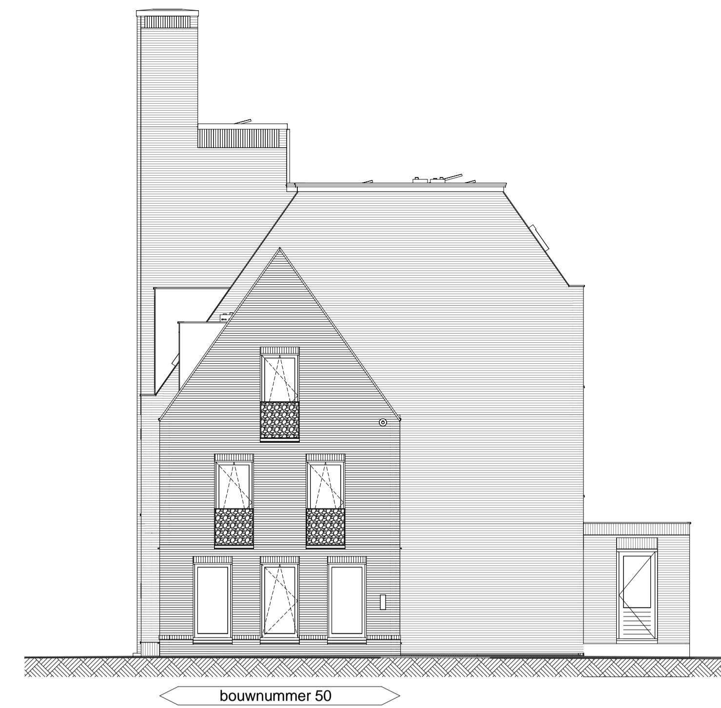
Rechterzijgevel schaal 1 : 100