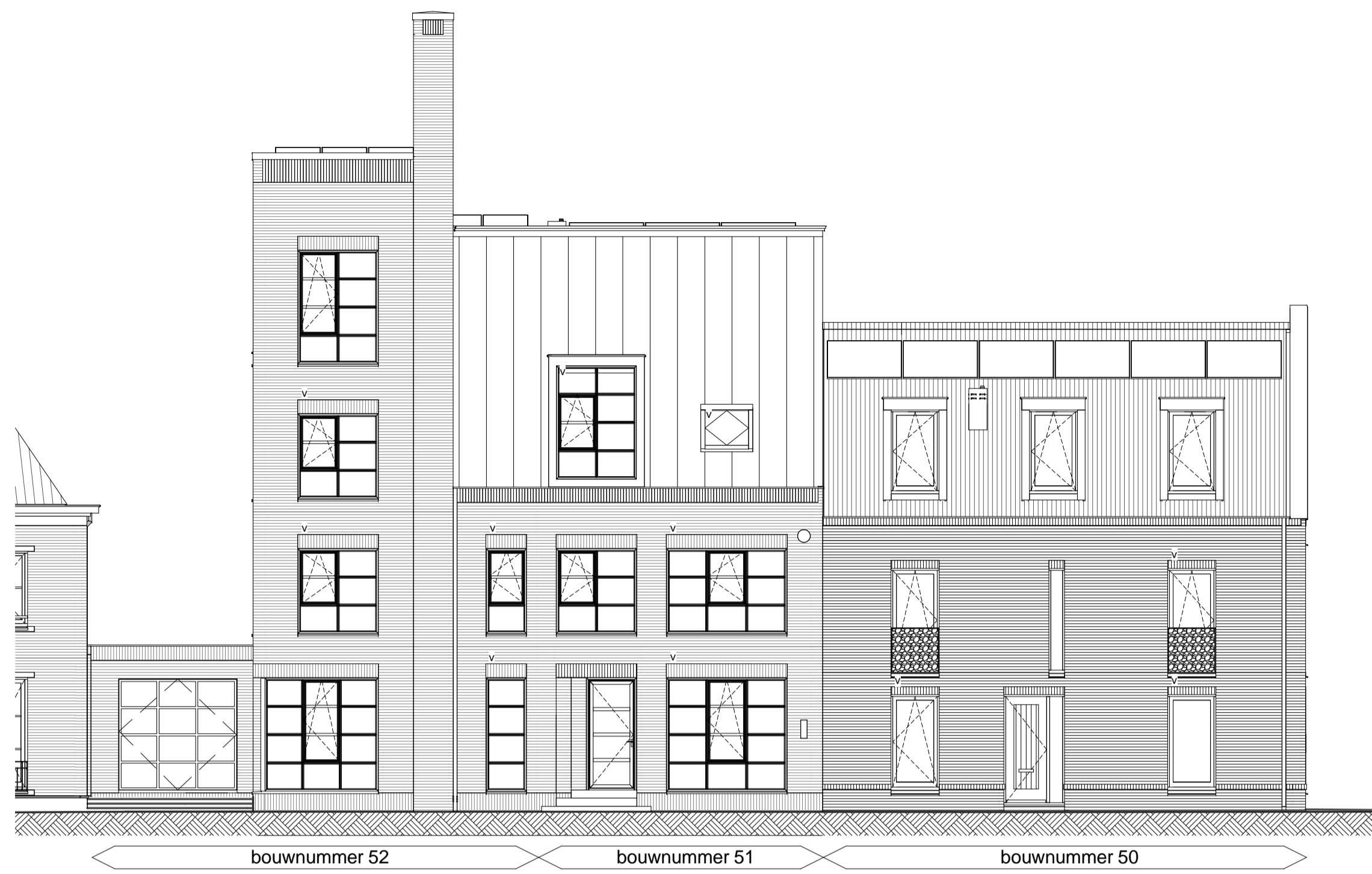
Voorgevel schaal 1 : 100