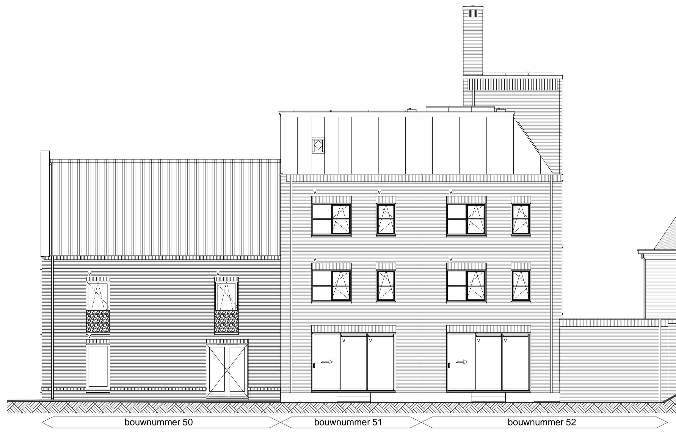
Achtergevel schaal 1 : 100