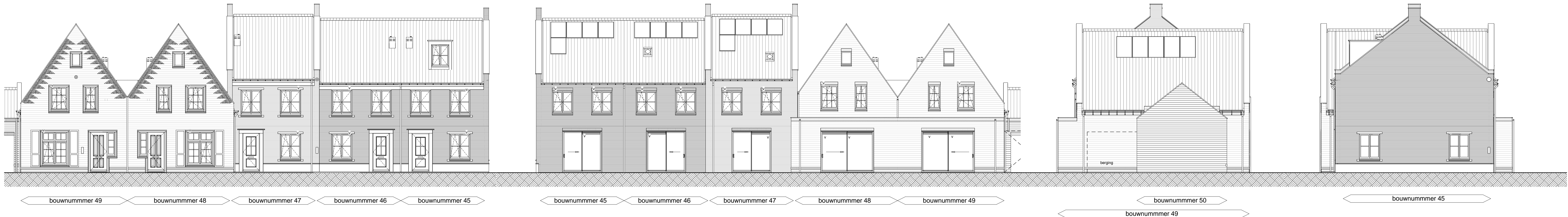
Vorgevel schaal 1 : 100