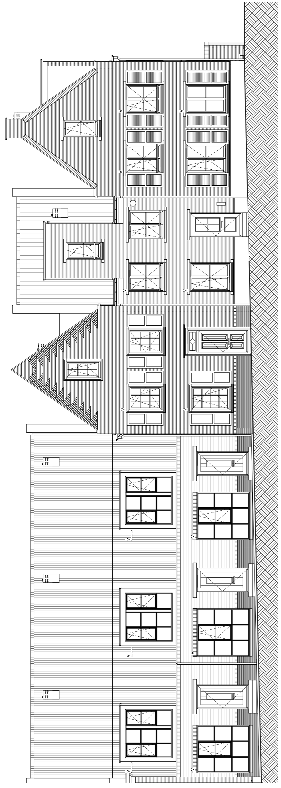
Voorgevel schaal 1 : 100

bouwnummer 95 bouwnummer 94 bouwnummer 93 bouwnummer 92 bouwnummer 91 bouwnummer 90