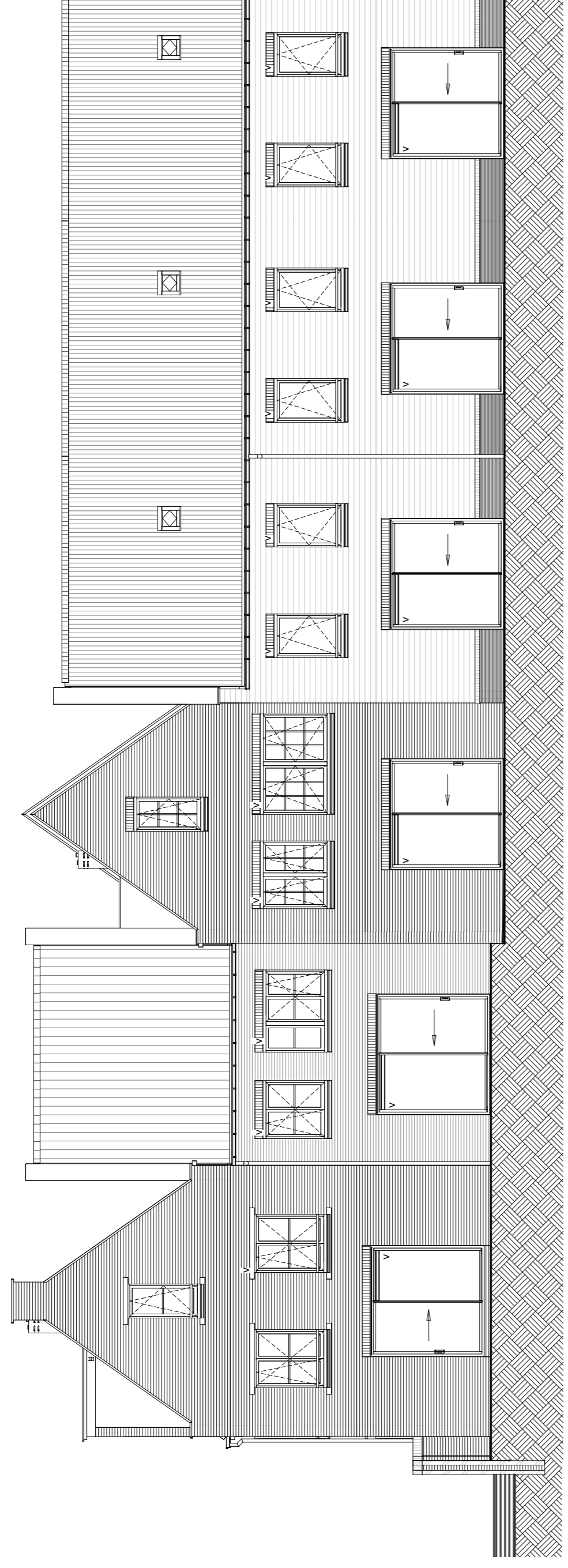
Achtergevel schaal 1 : 100

bouwnummer 95 bouwnummer 94 bouwnummer 93 bouwnummer 92 bouwnummer 91 bouwnummer 90