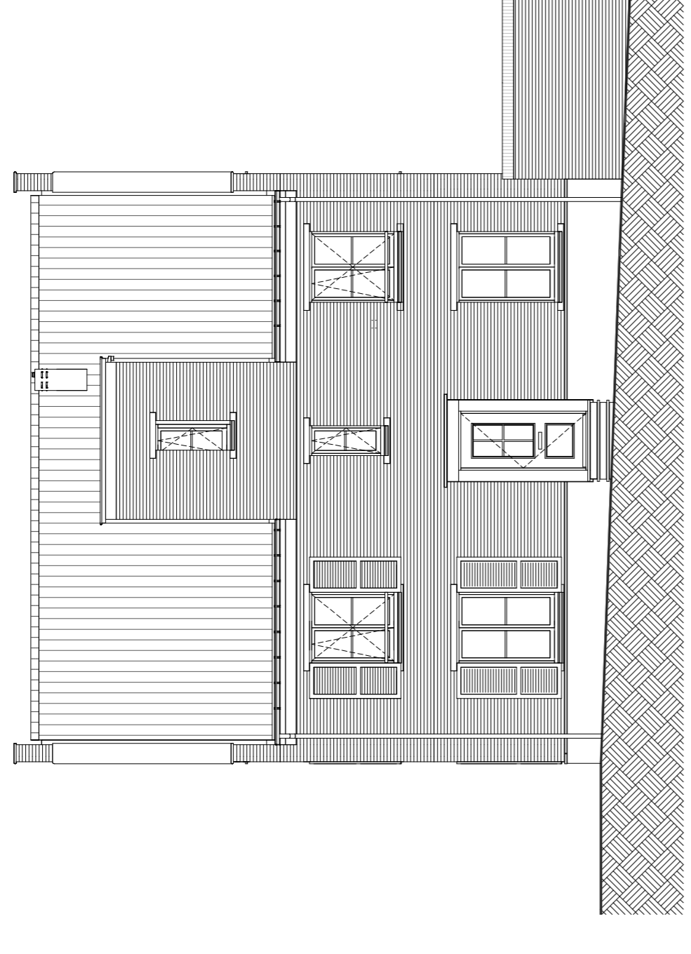
Rechterzijgevel schaal 1 : 100

bouwnummer 90 bouwnummer 91 bouwnummer 92 bouwnummer 93 bouwnummer 94 bouwnummer 95