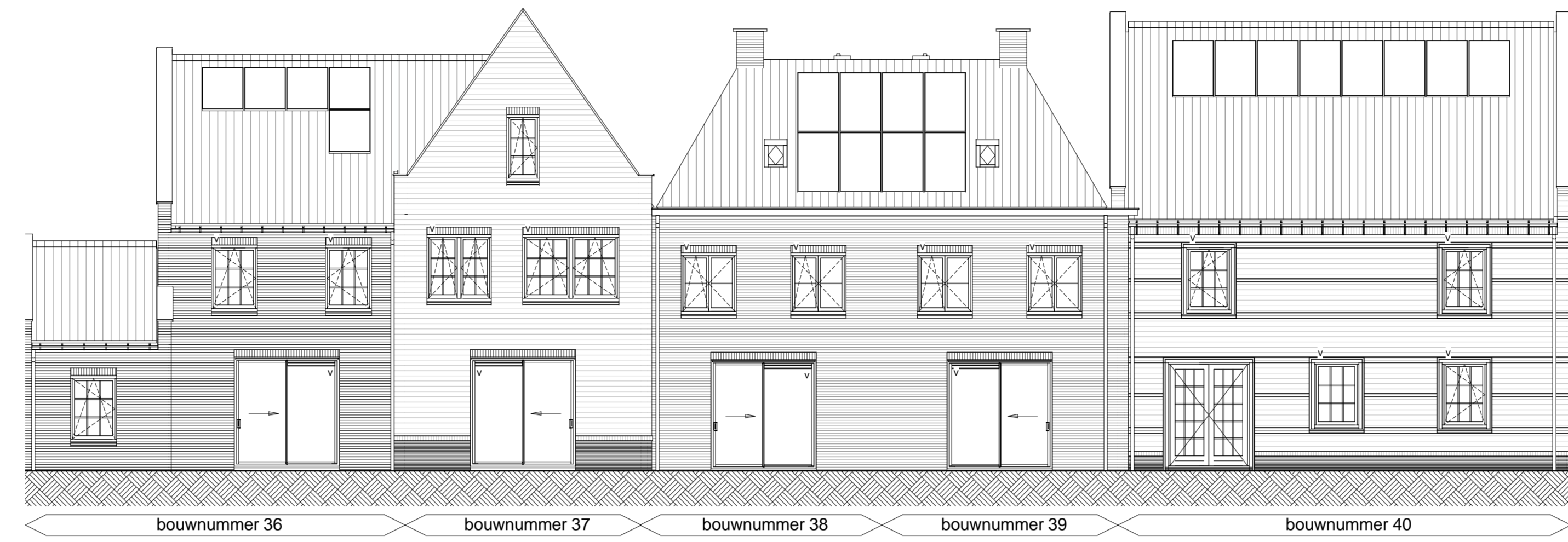
Achtergevel schaal 1 : 100