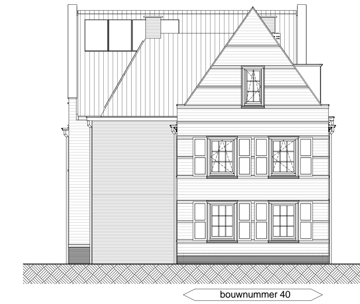
Linkerzijgevel schaal 1 : 100