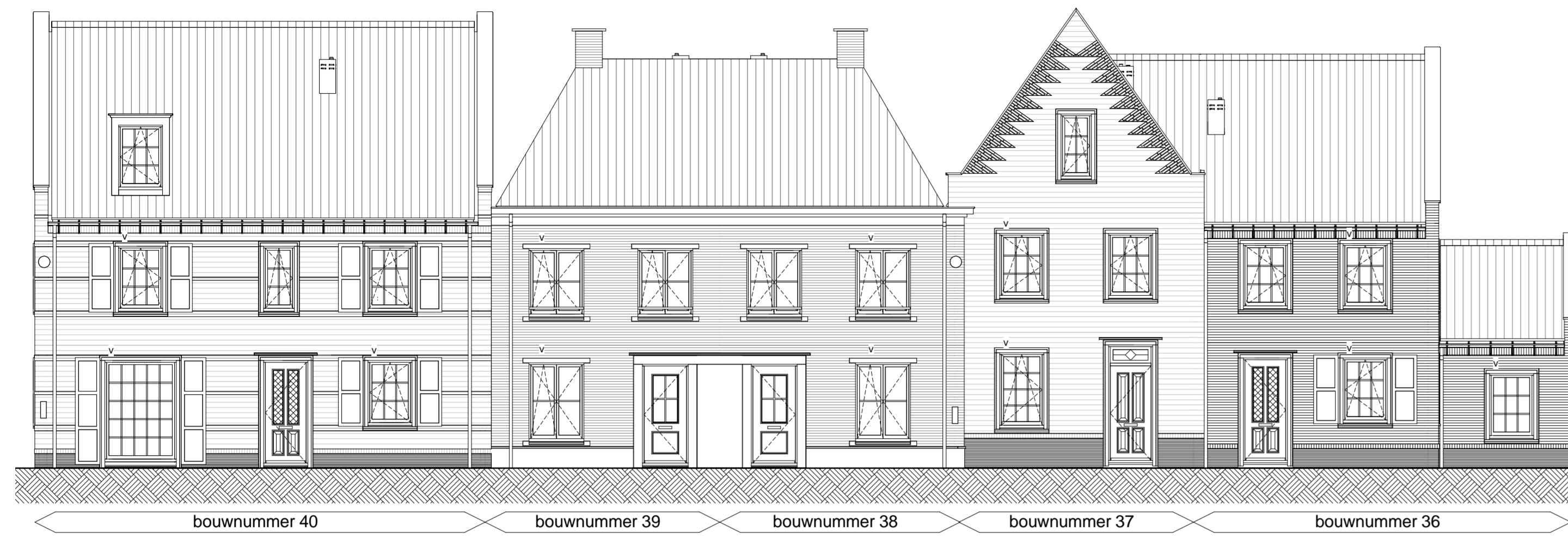
Voorgevel schaal 1 : 100