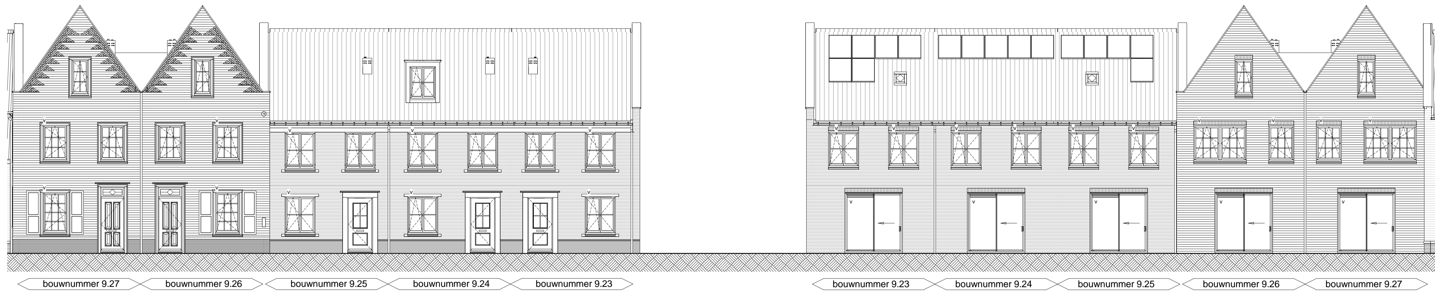
Voorgevel schaal 1 : 100